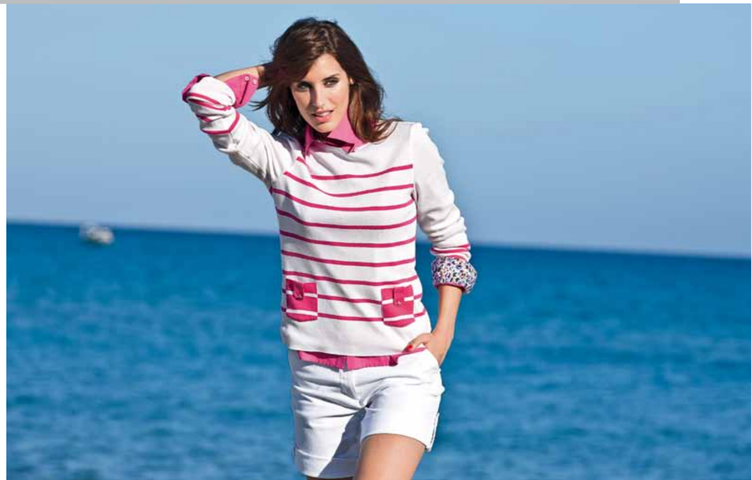
Pull BORMES · Chemisier CAROLE · Short SYLVANA