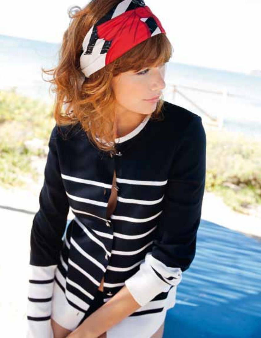
Gilet ST-MANDRIER Carré ST JAMES NOEUD