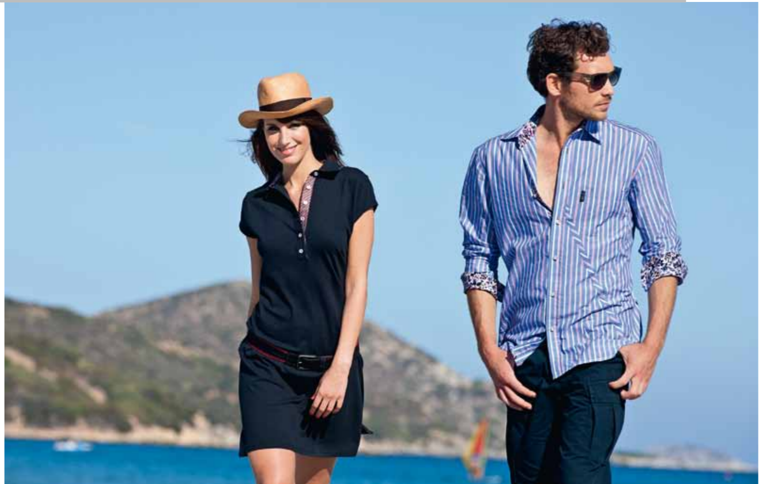
Robe AUDREY // Chemise ALEXANDRO · Short CORTO