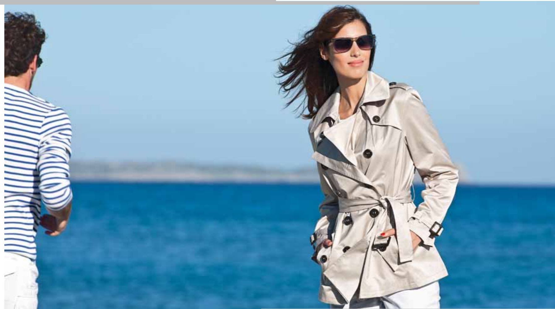
Pull BRITTANY // Imper STE-MAXIME