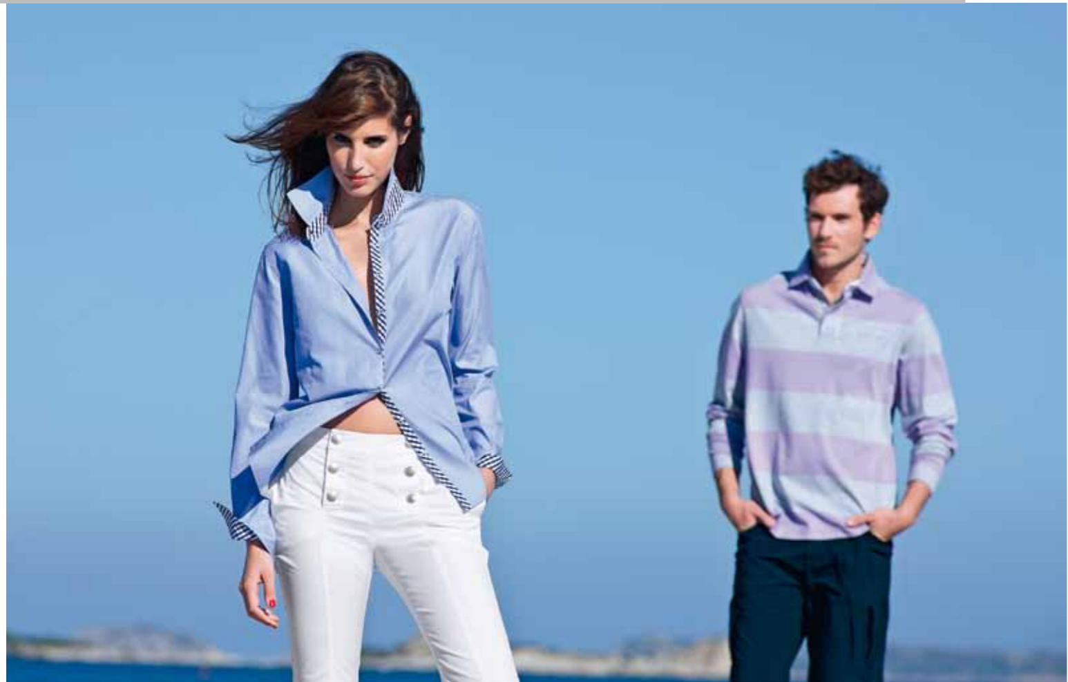
Chemisier ANNA · Pantalon CORSICA // Polo NEPTUNE