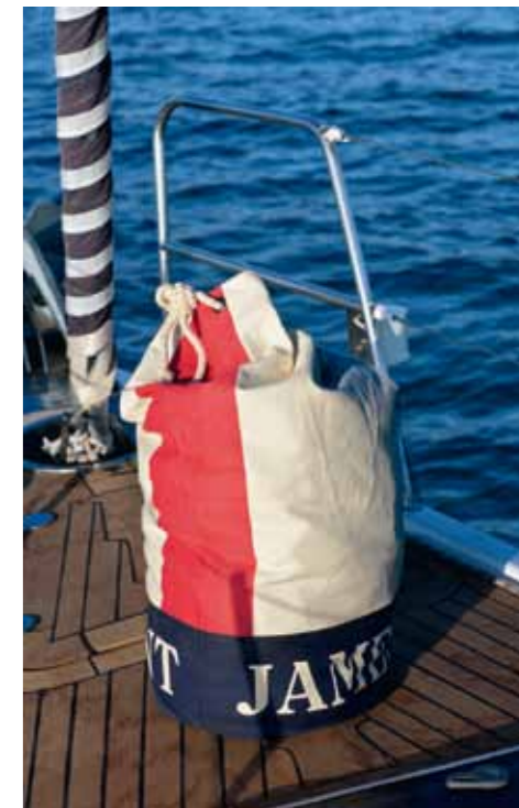
Grand baluchon sport